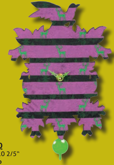
3033 PQ 26 cm = 10 2/5" Kuckulino