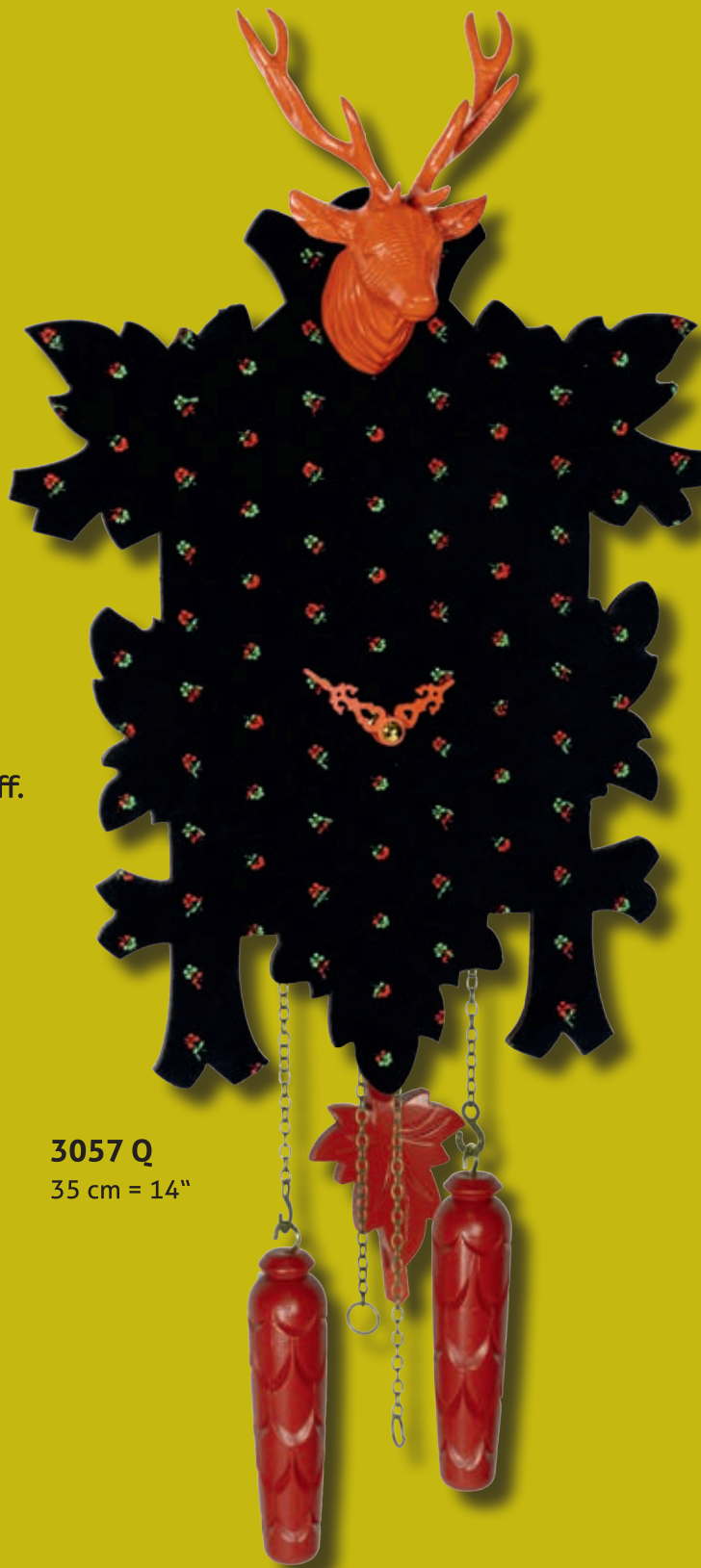
3057 Q 35 cm = 14"

Traditioneller schwarzwälder Trachtenstoff.