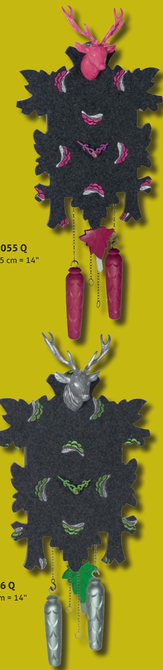
3055 Q 35 cm = 14"