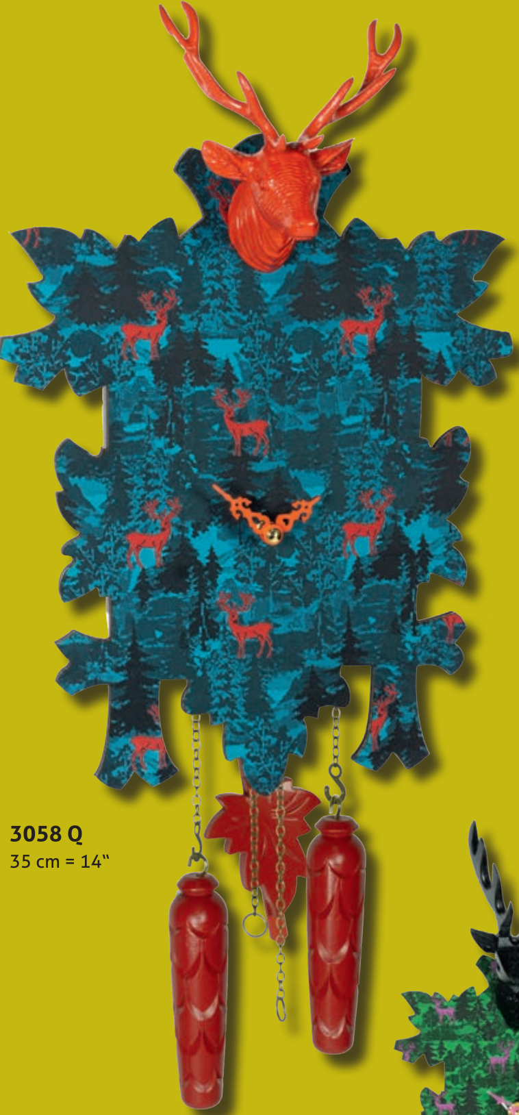
3058 Q 35 cm = 14"