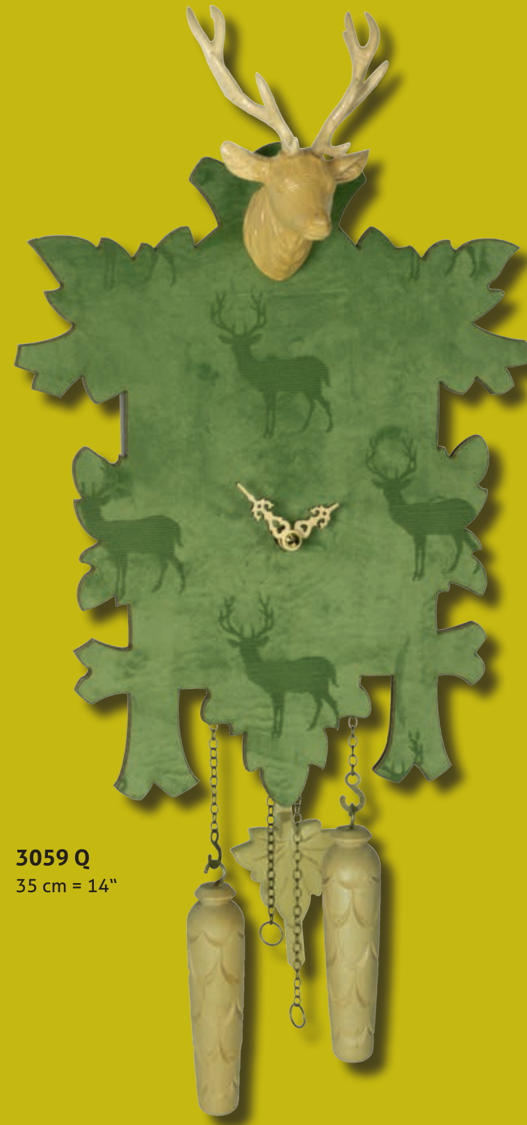
3059 Q 35 cm = 14"