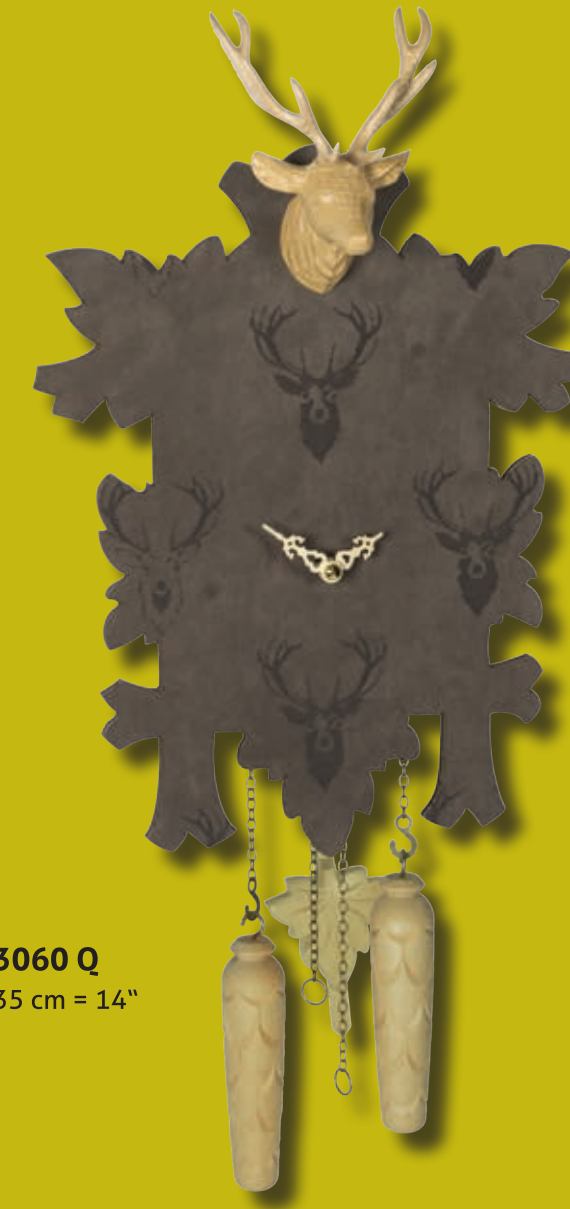
3060 Q 35 cm = 14"