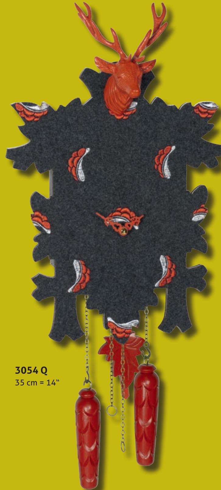
3054 Q 35 cm = 14"