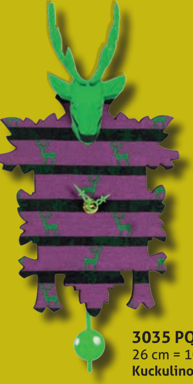
3035 PQ 26 cm = 10 2/5" Kuckulino